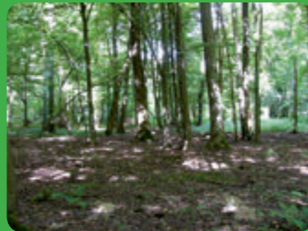
Frênaie-chênaie subatlantique à primevères © Biotope