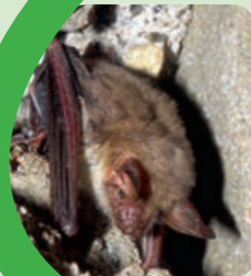
Grand murin

D'une superficie de 866 ha, le site Natura 2000 « Bois des Réserves, des Usages et de Montgé » se situe au nord-est du département de Seine-et-Marne, à la limite avec le département de l'Aisne. Il s'inscrit dans la petite région agricole de l'Orxois, dans le secteur de l'Ourcq, au nord de la Marne et à l'est de l'Ourcq.