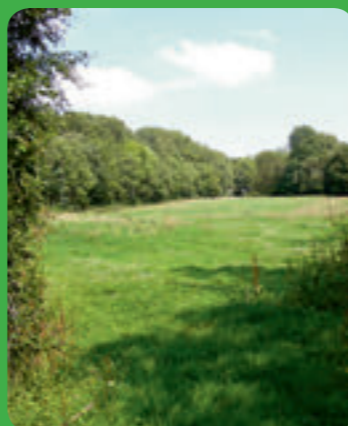
Prairie maigre de fauche