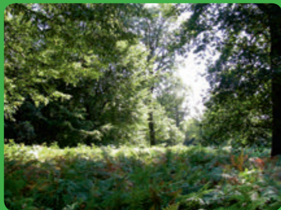
Hêtraie-chênaie à houx