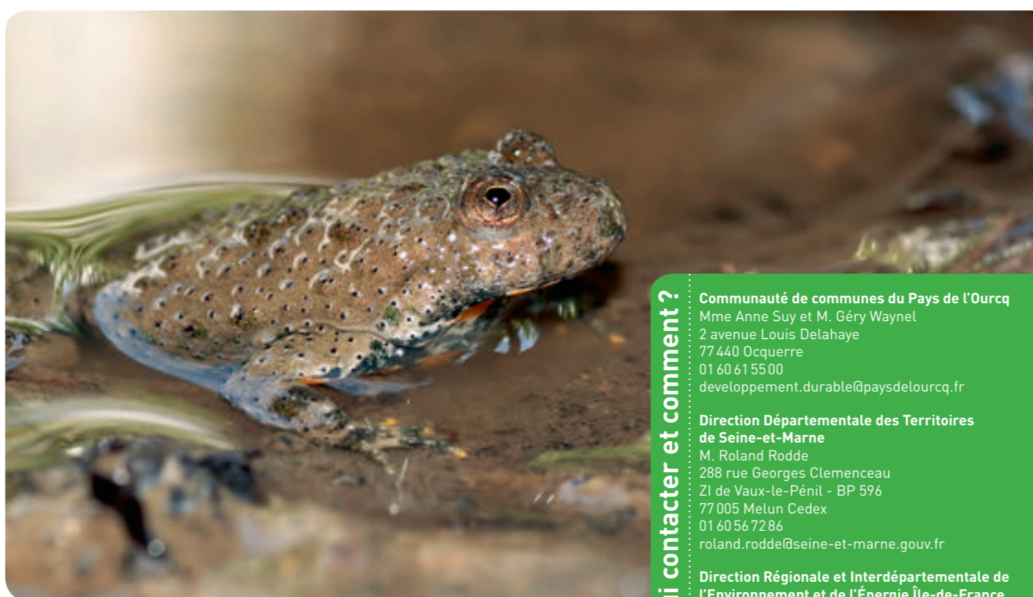
Photo couverture : Sonneur à ventre jaune. Ci-dessus : Sonneur à ventre jaune.