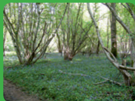
Hêtraie-chênaie à Jacinthe des bois