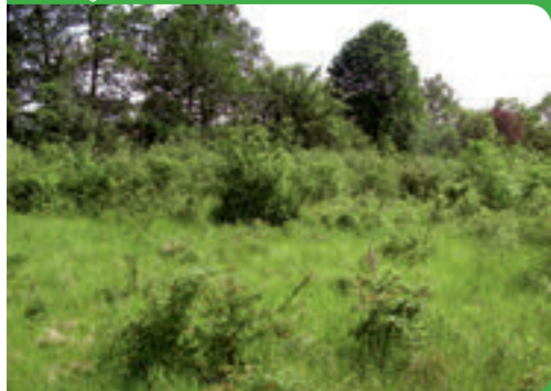
Pelouse calcaire

Les prospections de terrain réalisées en 2011 ont permis de recenser 8 habitats naturels relevant de la directive « habitats », non mentionnés dans le formulaire standard des données (FSD).