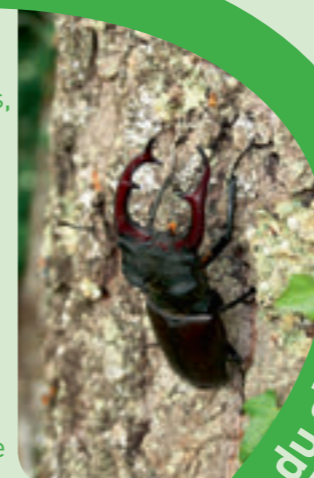
Lucane cerf-volant

Le site « Bois des Réserves, des Usages et de Montgé » a été désigné suite à la présence du Sonneur à ventre jaune, espèce d'amphibien protégée au niveau européen. Les prospections de terrain ont permis d'appréhender la richesse faunistique de ce site. En effet, le Lucane cerf-volant, insecte d'intérêt communautaire, ainsi que le Grand Murin et le Grand Rhinolophe, deux espèces de chauves-souris protégées au niveau européen, sont également présents sur le site.