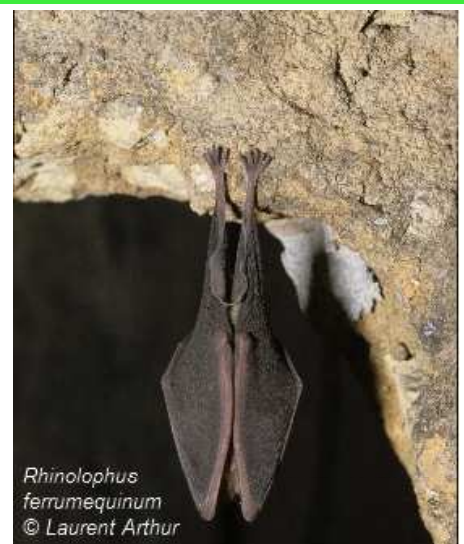
Rhinolophus ferrumequinum

Code : FR1102009 Statut : SIC (Site d'Importance Communautaire) Région : Ile-de-France / Département : Seine-et-Marne Commune : Darvault Superficie : 26,50 hectares Directive européenne : Habitats, faune, flore Transmission du site : 31 mars 2006 Arrêté de désignation : / Approbation du DOCOB : 23 janvier 2013 Président du comité de pilotage : Etat Structure animatrice : DDT de Seine-et-Marne Animateur : /