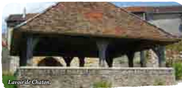
Lavoir de Chaton.

Le hameau de Chaton fait partie de la commune de Vendrest. Solidement campées à flanc de colline, les maisons témoignent encore de l'activité des habitants d'autant aussi trouve-t-on une statue de Saint-Vincent, patron des Vignerons. Le lavoir est l'un des plus appréciés de la région car il domine un point de vue remarquable sur le vallon du ru de Chaton avec le village de Cocherel en face.