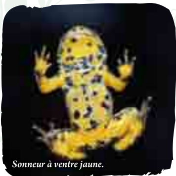
Sonneur à ventre jaune.

Depuis 2006, les bois des Réserves, des Usages et de Montgé, (situés sur les communes de Cocherel, Coulombs-en-Valois, Dhuisy et Vendrest) sont en cours de classement pour devenir une zone Natura 2000. En effet, ce massif boisé abrite la plus importante population régionale de crapauds sonneurs à ventre jaune, mais aussi d'autres espèces fragiles telles le lucane cerf-volant pour les insectes, ou encore le Grand Murin et le Grand Rhinolophe qui sont deux espèces de chauves-souris protégées en Europe. La démarche de protection de ce site vise essentiellement à mieux prendre les richesses naturelles en compte dans le cadre des activités humaines pratiquées en forêt, qu'elles soient liées à une activité forestière ou aux loisirs, et ce, afin de conserver et de pérenniser des écosystèmes qui deviennent de plus en plus menacés.