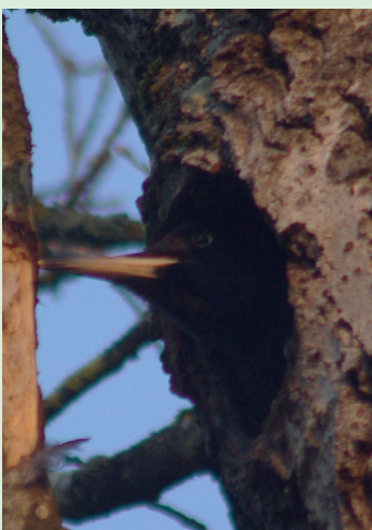
Pic noir dans sa loge