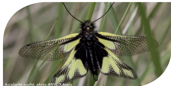
Ascalaphe soufré