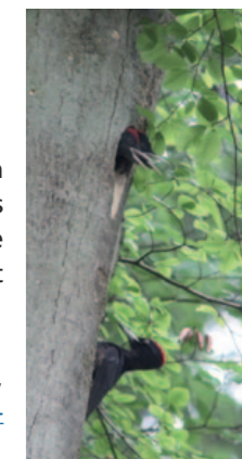
Pic noir

Pour plus d'informations sur le suivi de ces espèces, rendez-vous sur les sites internet : http://seine-et-marne.n2000.fr ou http://www.anvl.fr/