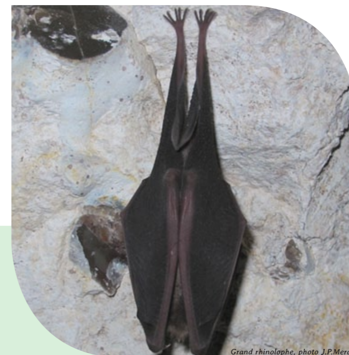
Grand rhinolophe

Le massif semble jouer un rôle non négligeable dans l'écologie des chiroptères grâce à la mosaïque d'habitats que celui-ci présente. Le site Natura 2000 compte six espèces de la directive « Habitats, faune, flore ». Au regard des effectifs de ces populations en régression sur l'ensemble du territoire national, le docob fait de ces espèces une priorité forte. Les données actuelles restent concentrées sur les réserves biologiques, secteurs trop restreints pour permettre la compréhension de l'utilisation du massif par ces espèces. Pour pallier à ce manque, le suivi mené, comprenant environ 300 points d'écoute, affinera les connaissances sur la distribution des chauves-souris sur l'ensemble de la forêt.