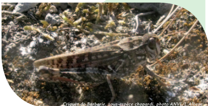
Criquet de Barbarie, sous-espèce chopardi, photo ANVL/L. Albesa