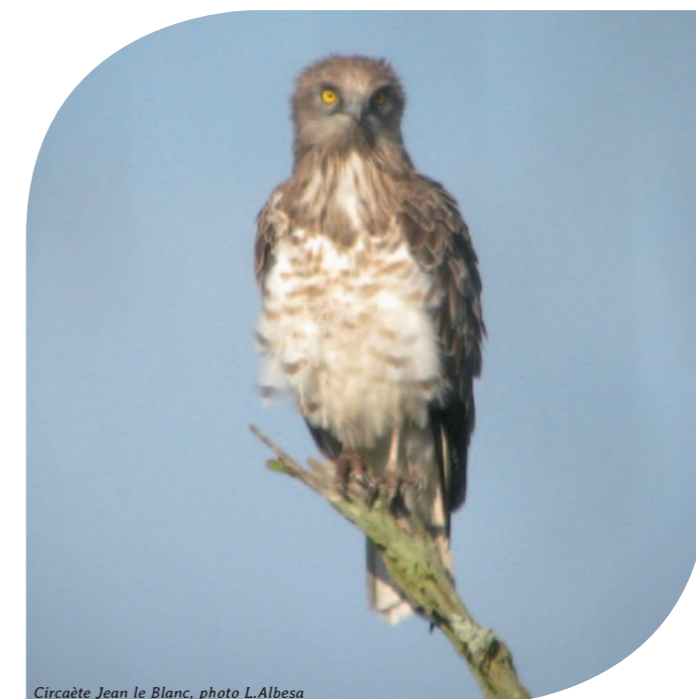
Circaète Jean le Blanc